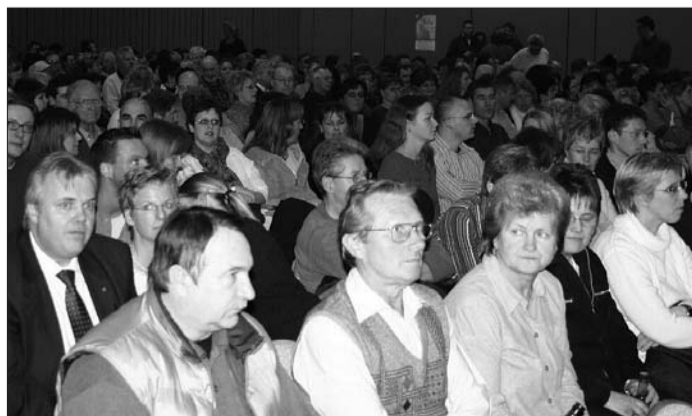
Schon lange vor der Veranstaltung waren die Karten für „Erwin“ vergriffen. Die Hegelsberghalle war am Montag bis auf den letzten Platz besetzt. Wer nicht kommen konnte, gab seine Karten an Freunde weiter – wie das auch in der Comedy-Hall in Bessungen, der Heimstatt des Kikeriki-Theaters – gemacht wird.

Wie gleich zu Beginn angekündigt, wurde bei diesem respektlosen Puppenspiel nicht viel gedacht, sondern nur gelacht. Aber immerhin handelte es sich ja auch nicht um das Beste, dafür aber um das bekloppteste hessische Theater und somit im wahrsten Sinne des Wortes um ein tierisches Vergnügen für die Zuschauer. tam