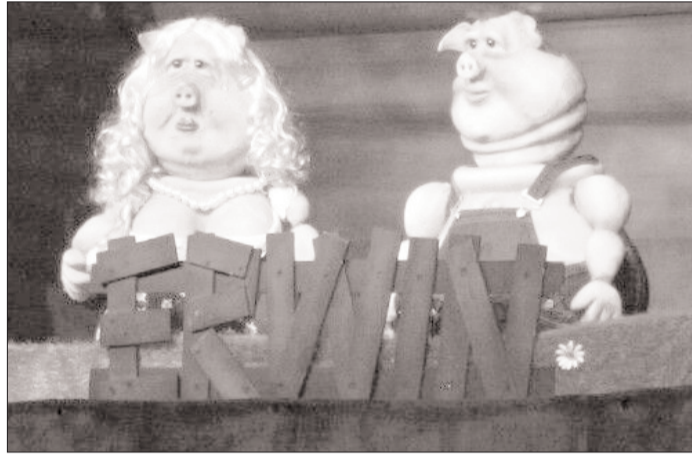
„Erwin, ein Schweineleben“ war das Stück des Darmstädter Kikeriki-Theaters, das am Montag vor ausverkaufter Halle in der Hegelsberghalle gezeigt wurde. Die Zuschauer amüsierten sich dabei prächtig.